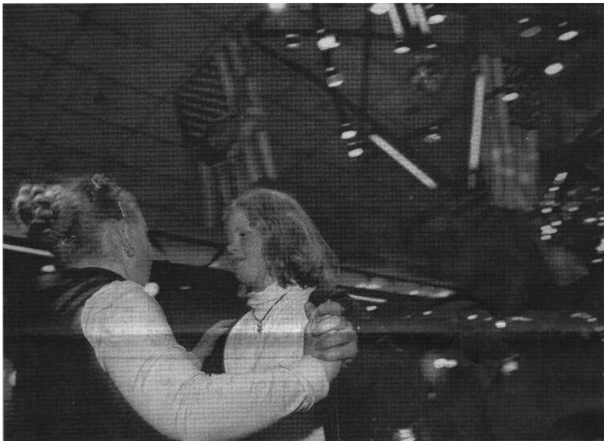
Al zijn er te weinig jongens, gedanst wordt er toch wel bij dansschool Wuyster in Spijkenisse.