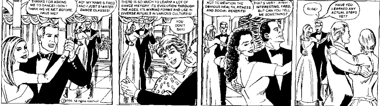
FOOTLIGHTS by Larry Fuller and Dan Bulanadi