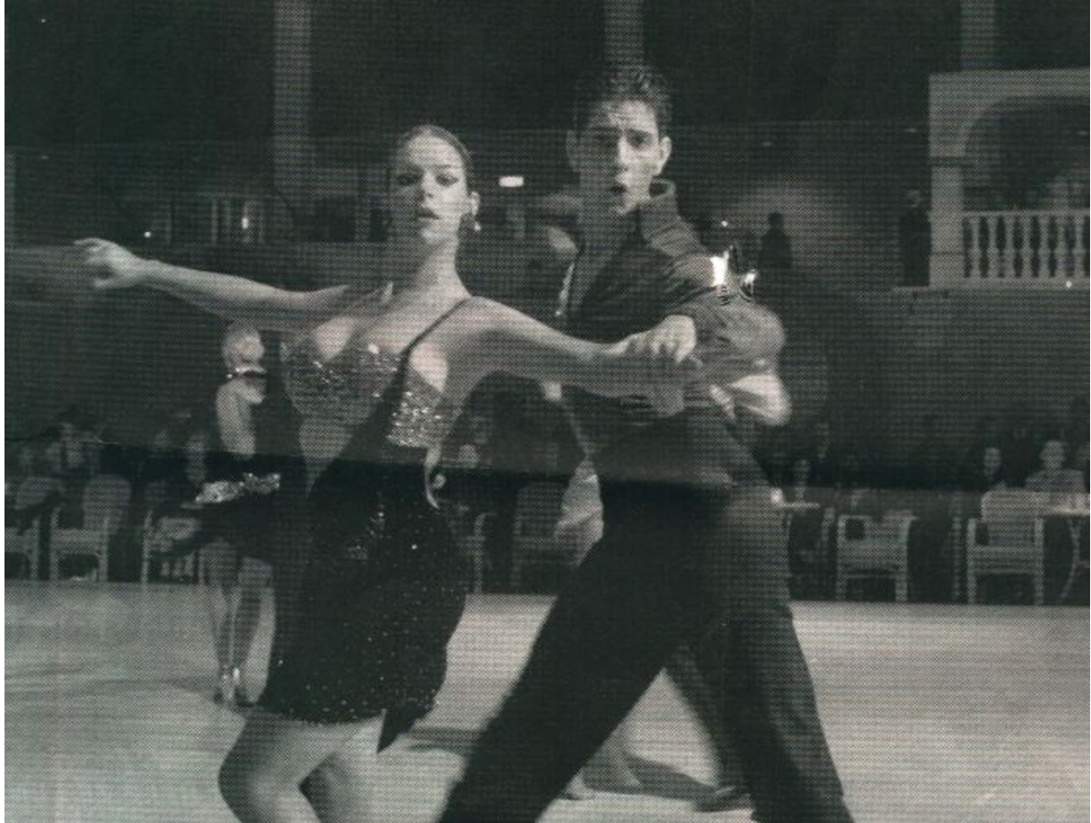
Opperste concentratie op de gladde vloer

Topsport is het: stijldansen op wedstrijdniveau. Nauwelijks meer te vergelijken met de slow-slow-quick-quick-slow op bruiloften en partijen. Vier dagen lang spannen zo'n drieduizend dansers en danseressen zich in tijdens een van de grootste internationale stijldansfestivals: Dans 2001 in Assen. Zowel amateurs als professionals uit verschillende landen strijden om diverse titels. Achter de perfect opgemaakte gezichten, de perfect getrainde lichamen en de perfect gesneden glitterkleding gaat een wereld schuil van hard werken, doorzetten en afzien. Maar ook van veel plezier.