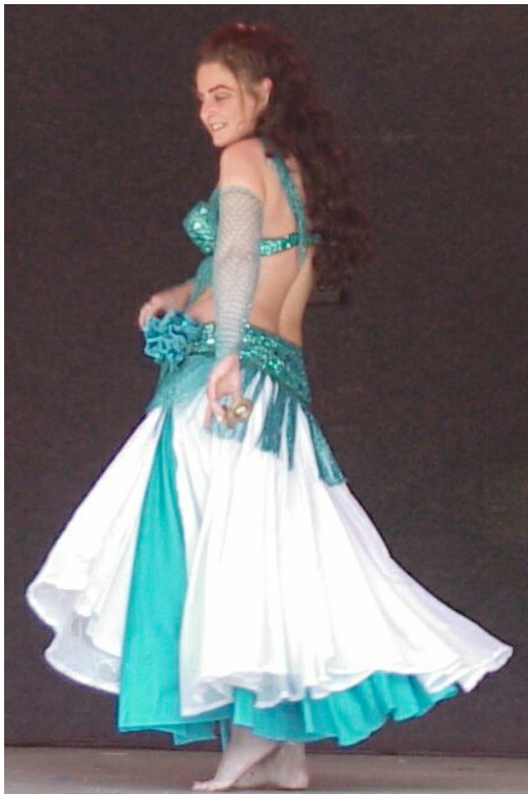
05-05-2000 - Buikdanseress