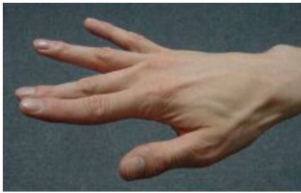
Cha Cha Cha, Jive, Samba en Paso Doble