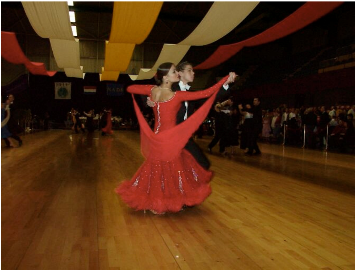
Benelux Danskampioenschappen in 's-Hertogenbosch