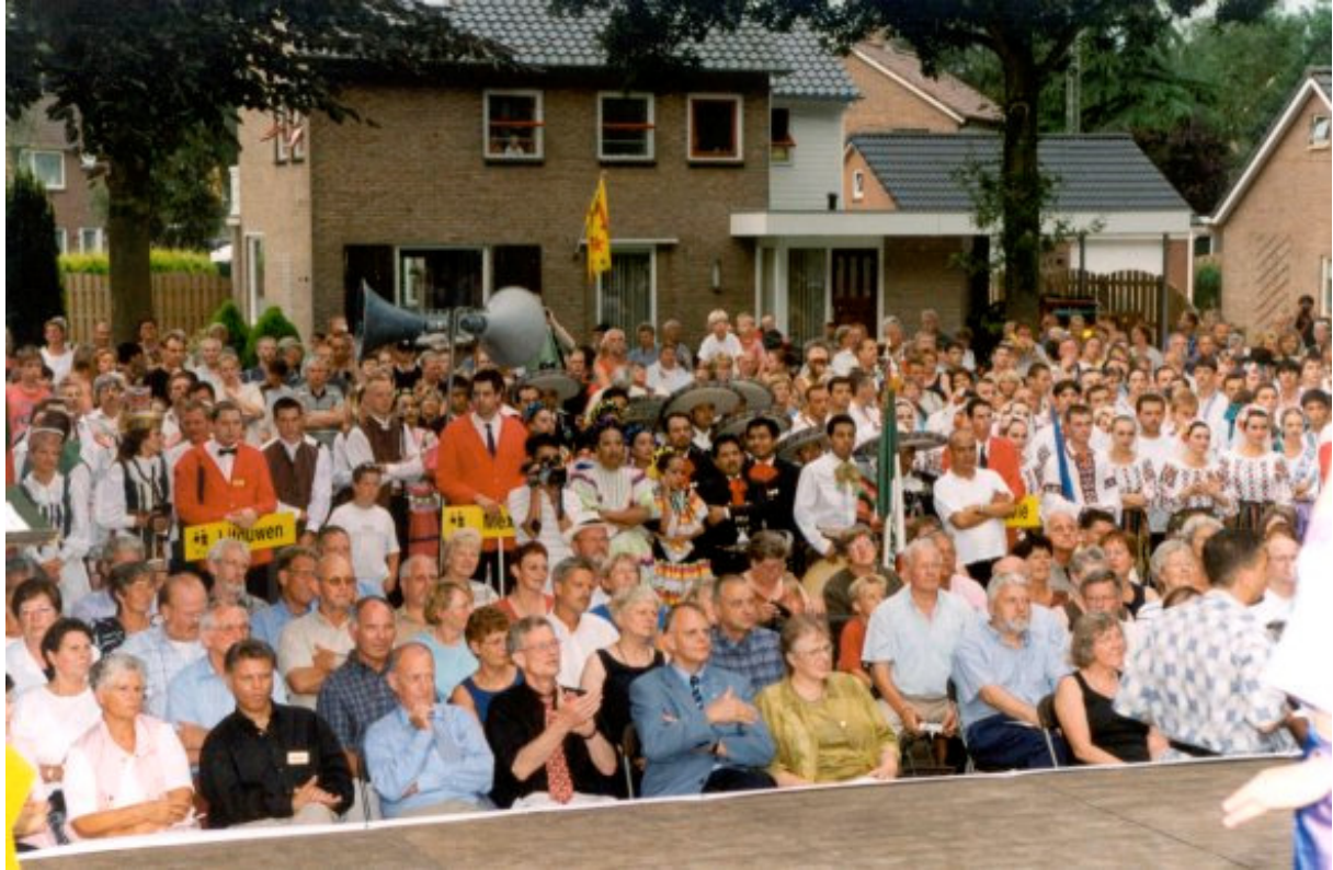
Opening SIVO 2002

Verder heeft de organisatie nog een groot aantal kleine werkgroepen die elk een klein onderdeel van de organisatie voor hun rekening nemen.