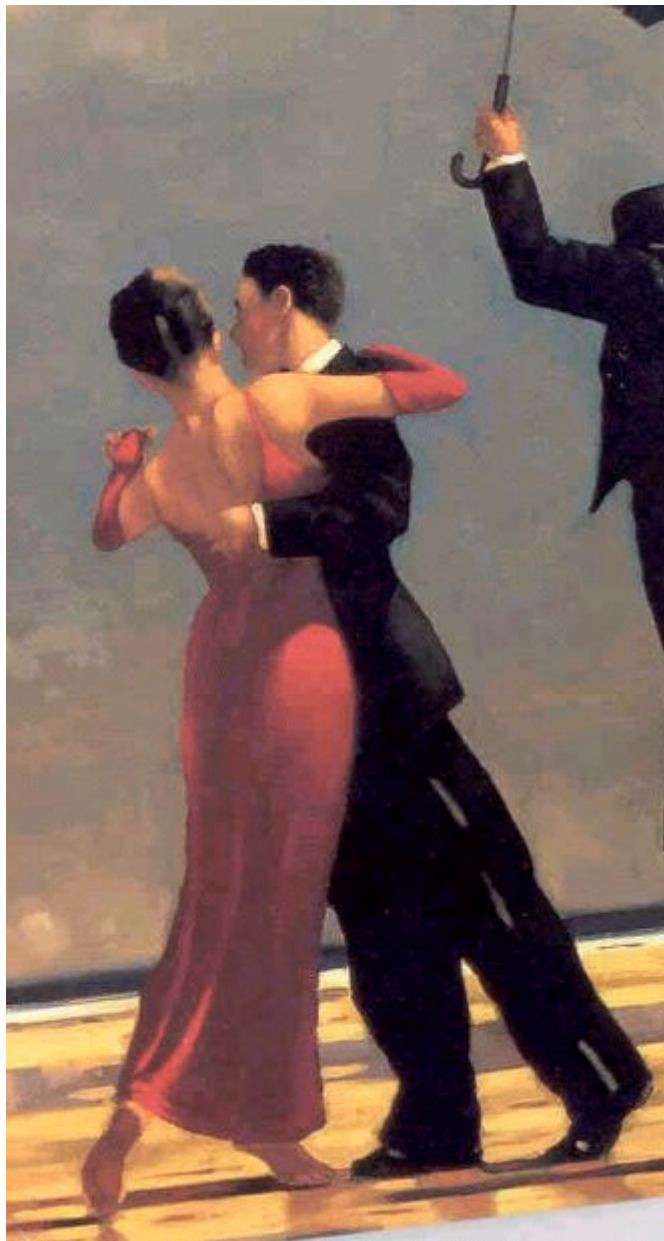
Danspaar van Vettriano