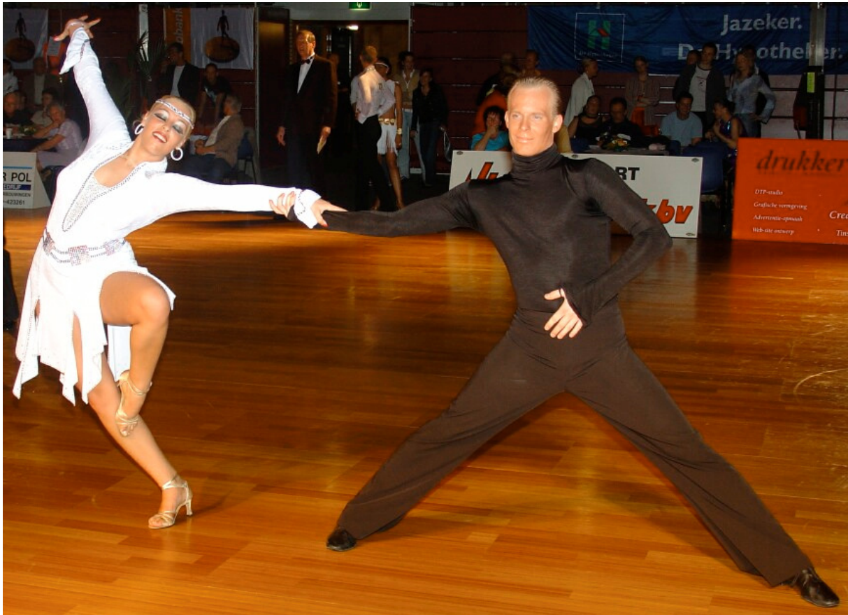
Latin Night in Ridderkerk