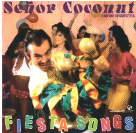
Fiesta Songs Señor Coconut and his Orchestra

Via e-mail kreeg ik een bericht voor op mijn site opgestuurd over een optreden van Señor Coconut. Toen ik zijn cd "Fiesta Songs" op http://www.bol.com beluisterde bleek er leuke dansbare muziek op te staan. Het zijn vooral bekende nummers die in een Latin jasje zijn gestoken. Ik heb nog een cd van Señor Coconut gekocht en die zie je ook nog wel een keer in het dansblad verschijnen.