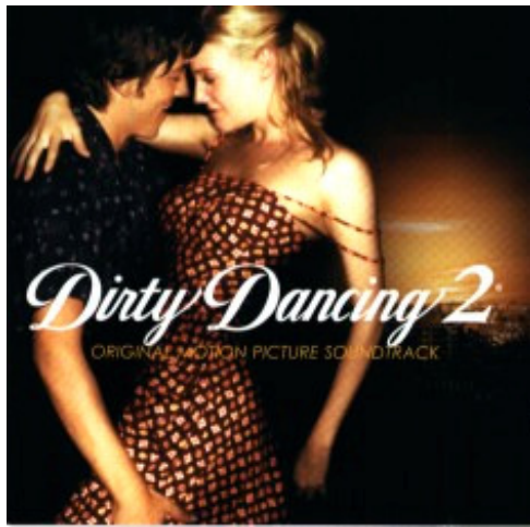
Dirty Dancing 2 Original Motion Picture Soundtrack

Ik zal het maar gelijk zeggen. Ik heb er spijt van dat ik deze cd heb gekocht. Maar ja, ik had ook eerst moeten luisteren. Aan de andere kant mag ik toch wel verwachten dat er bij deze film leuke dansbare muziek hoort. De meeste muziek op deze cd is erg moderne rap muziek. Zeg nou zelf, dat past toch niet bij een film die zich afspeelt in 1958. Muziek bepaalt voor een groot deel de sfeer van een film. Ik heb de film nog niet gezien, maar ik hoop dat ik die wel leuk vind. Op internet las ik aardig wat reacties van mensen die de muziek wel leuk vinden. Smaken verschillen, maar ik raad je aan om eerst even te luisteren. Het enige leuke nummer vind ik de instrumentale versie van “Do you only want to dance”. Zoals je ziet heb ik toch achter aardig wat nummers een dans vermeld. In noodgevallen kun je ook best wel op deze muziek dansen. De muziek bij Dirty Dancing 1 (zie dansblad 18) vond ik een stuk beter. In dansblad 61 kun je lezen wat Miranda van de film Dirty Dancing 2 vond.