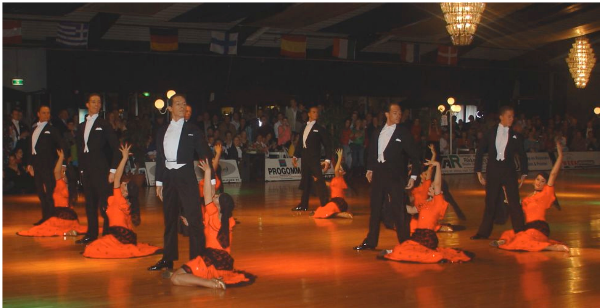
Voetisch Formation Team (WSI 2005)