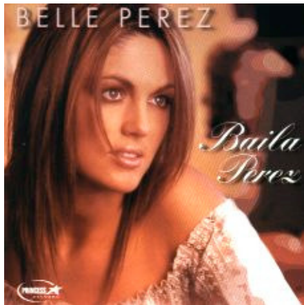
Belle Perez Baila Perez

Belle Perez is erg populair in België. Deze cd viel me op door de titel “Baila Perez”. Baila betekent namelijk dansen. Op deze cd moest dus wel wat dansbare muziek staan. En ja hoor, er staan vooral een aantal hele leuke Samba’s op.