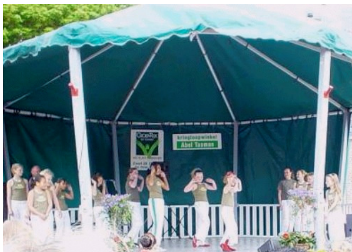
Het jonge demo team gaf een perfect staaltje street dance weg

Ook de meiden van het street dance team hadden een spetterend optreden.