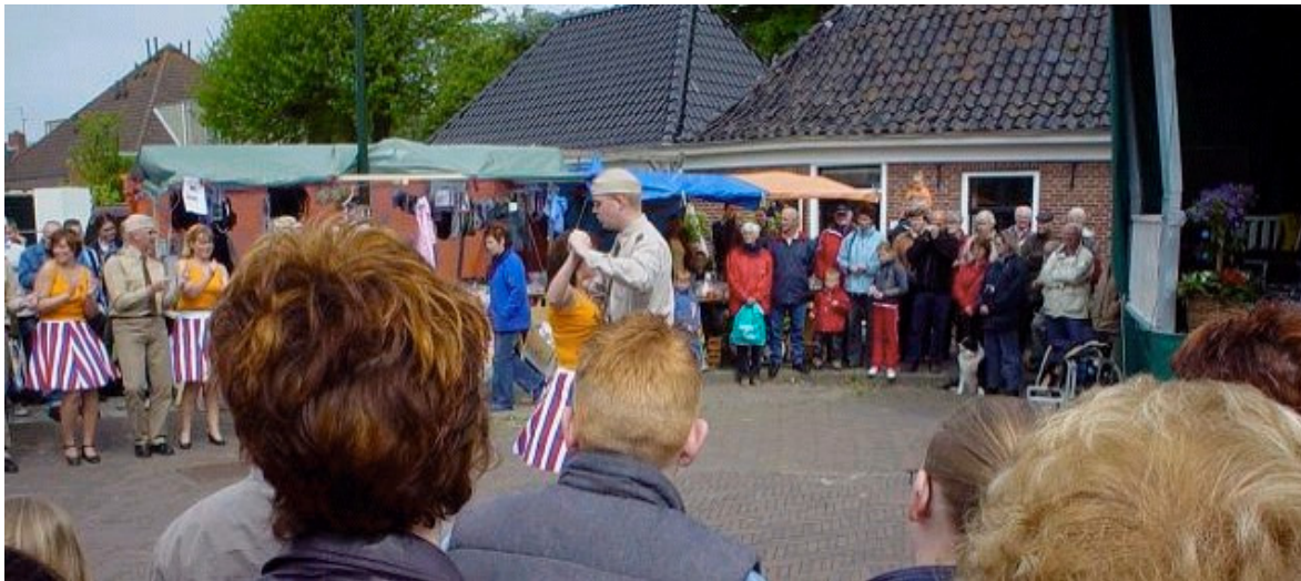
Het hele dorp was uitgelopen om naar de danskunsten te komen kijken

In het kader van zestig jaar bevrijding was de dansschool gevraagd om ook een duit in het zakje te doen. Dit resulteerde in een optreden geheel in het teken van de 'bevrijding'. De heren waren gekleed in een heus uniform terwijl de dames wulpse rokjes droegen compleet met petticoat. (dit werd overigens door de Canadese veteranen ontzettend gewaardeerd, u begrijpt misschien wel waarom?!) Er werd o.a. een quickstep, slowfox en boogie-woogie gedanst, op de klanken van typische jaren '40 muziek.