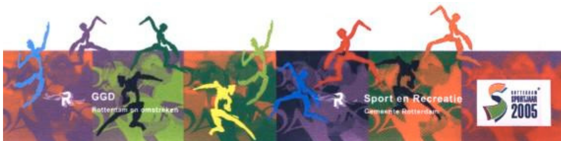
Day of Dance 21 mei 2005