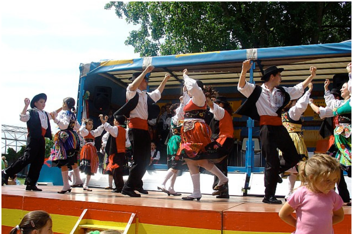
Fiesta del Sol - Portugese dans