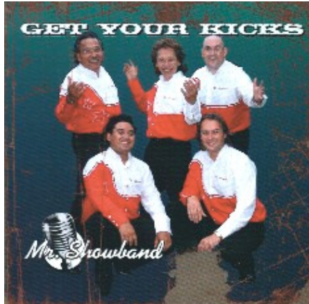
Get Your Kicks Mr. Showband