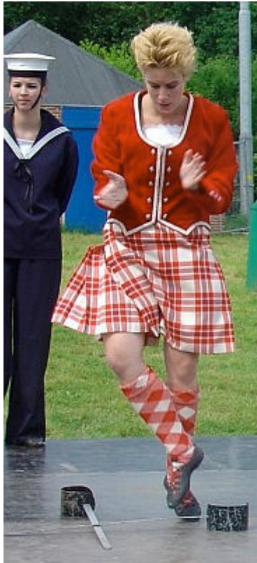
Sword Dance (Zwaarddans)

De Hornpipe is een vrolijke dans waarbij de werkzaamheden op een schip worden uitgebeeld. Er wordt hierbij een matrozenpakje gedragen.