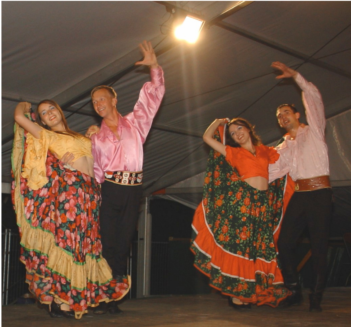
SIVO dansfestival (Moldavië)