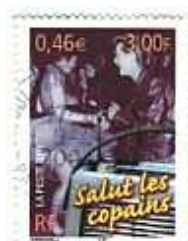
Frankrijk 2001 Rock & Roll

Rock & Roll, Wals, Tango, Cha Cha Cha en Samba