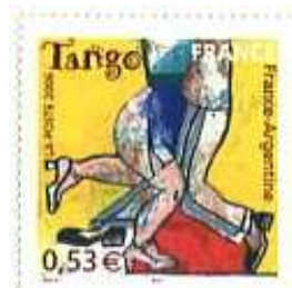
Frankrijk 2006 Argentijnse Tango