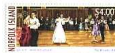
Norfolk 2006 The Bounty Ball