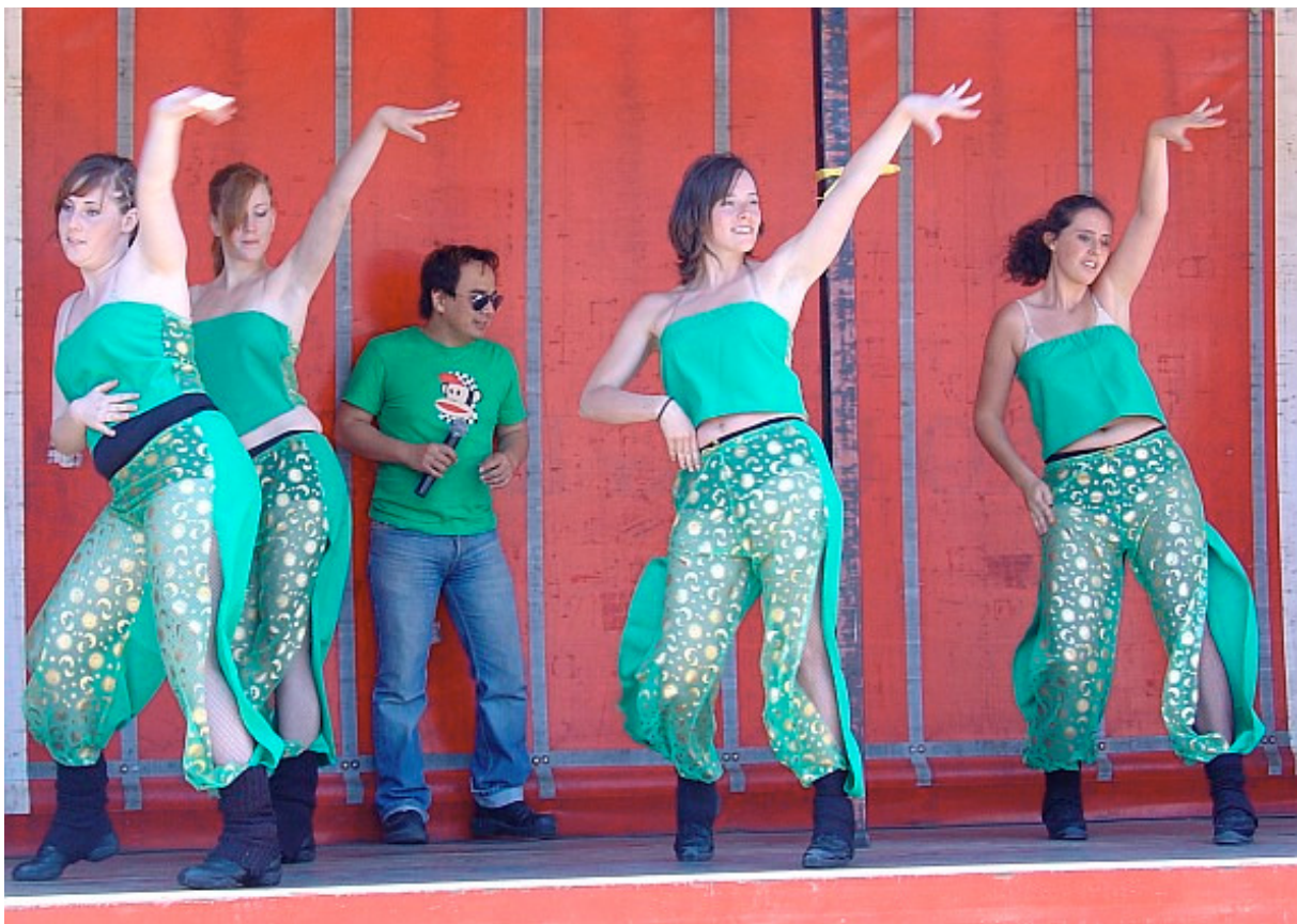
Koninginnedag in Zwijndrecht