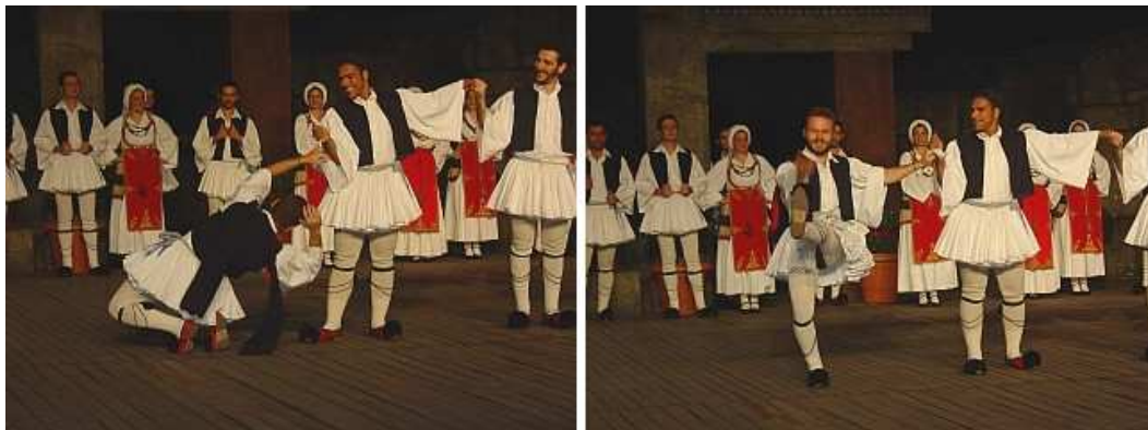
Tsamikos in het Dora Stratou theater in Athene

http://www.trilulilu.ro/carmenviorica/93907e3568589c