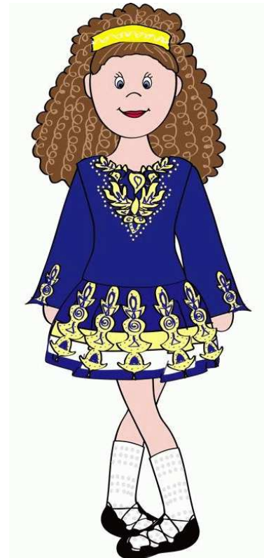
Getekend door: BethanysMAID

http://nl.wikipedia.org/wiki/Ierse_stepdance http://en.wikipedia.org/wiki/Jig http://en.wikipedia.org/wiki/Treble_jig http://www.irelandseye.com/aarticles/culture/music/dance/hist.shtm http://www.youtube.com/watch?v=-ijk4Yox4r0