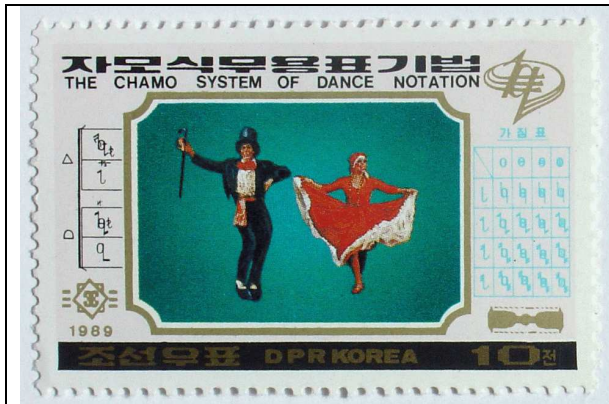
Mexicaanse volksdans (10 chon)

Net als bij de Koreaanse taal worden de symbolen vaak gecombineerd. Rechts op de postzegel met de Mexicaanse volksdans is te zien hoe de vorm-symbolen kunnen worden gecombineerd met de plaats-symbolen. Er zijn echter nog veel meer mogelijkheden. TIP: Als je dit dansblad in Word leest, dan kun je inzoomen om de postzegels beter te zien.