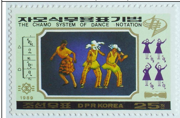
Guineese volksdans (25 chon)