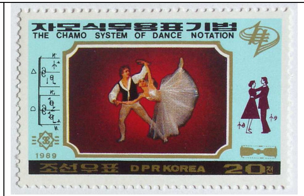
Ballet (20 chon)