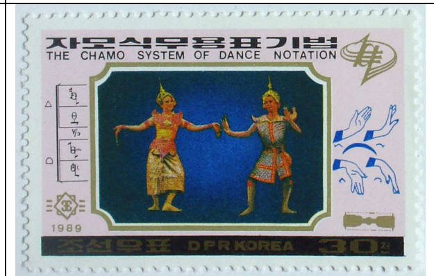
Cambodjaanse volksdans (30 chon)

Een vorm-symbool aan de rechterkant van een plaats-symbool wordt 180 graden gedraaid en zegt iets over de vorm van de rechterkant van het lichaam zoals bijvoorbeeld de rechterarm of het rechterbeen, afhankelijk van waar het symbool op de balk staat. Links steekt het vorm-symbool symbool naar boven uit en rechts steekt het vorm-symbool naar beneden uit. Dit heeft niets met hoogte te maken. Met het vorm-symbool wordt alleen de buiging aangegeven.