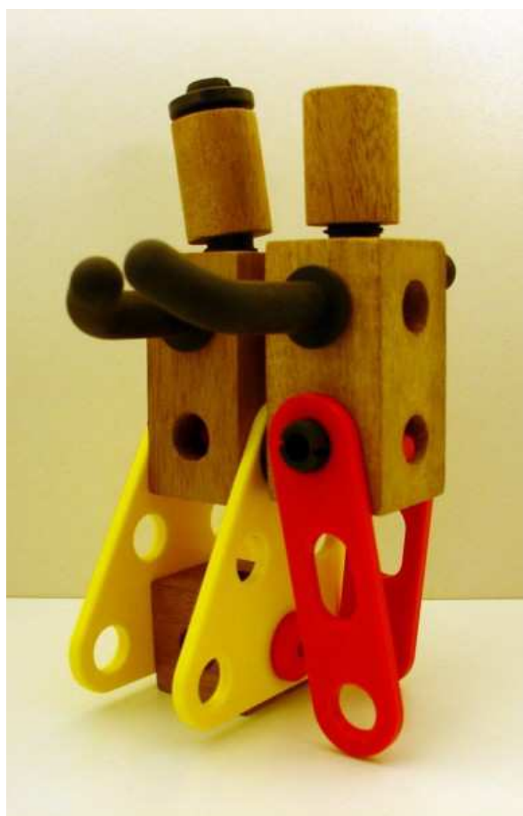
Danspaar gemaakt van IKEA constructiespeelgoed