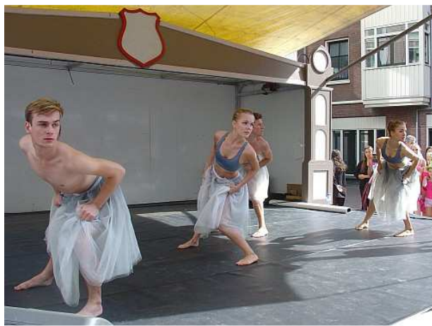
Op het podium