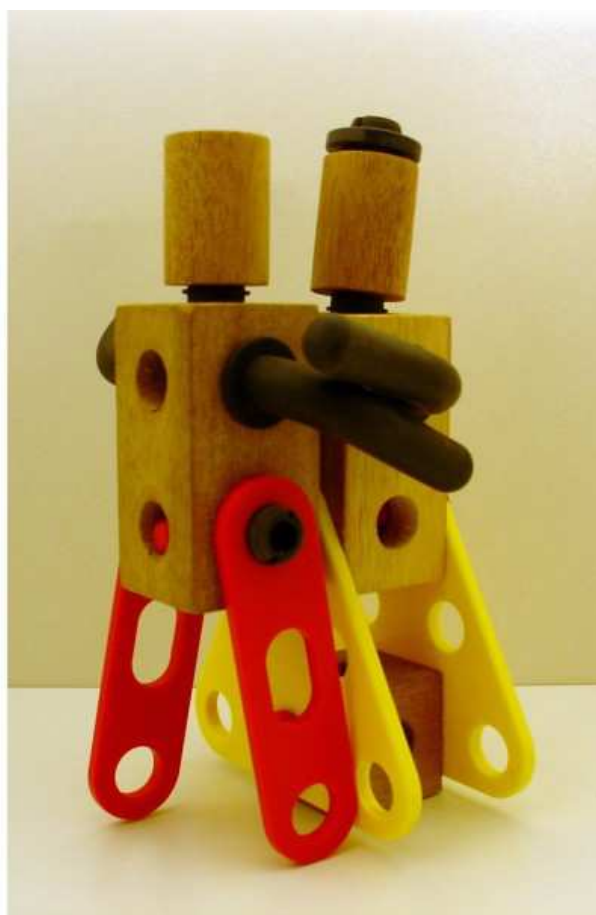
Ontwerp: Fred Bolder