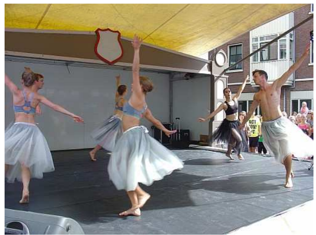
Op het podium

Na dit optreden volgden nog veel meer dansoptredens. We kregen o.a. Acrorock, Bollywood, Stijldans, Jazzdance en Streetdance te zien. De stijldansers waren van dansschool Residence Dorany. Ze dansten de Cha Cha Cha en de Jive. Het dansen zag er goed uit, alleen jammer dat een danspaar bij de Cha Cha Cha alles een tel te vroeg danste waardoor de chassés op de tellen 3 & 4 i.p.v. 4 & 1 werden gedanst.