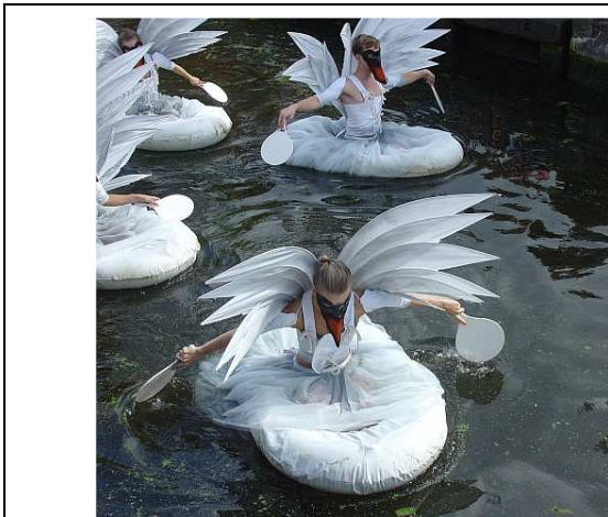
In het water van de Vliet

Tijdens de Vlietdagen is er van alles te zien en te doen op en rond het kanaal de Vliet in Leidschendam en Voorburg. Ik ben zondag 14 september naar het Damplein geweest, want daar verzorgde Stichting Dans aan de Vliet een compleet dansprogramma. Vanwege hun 5-jarig jubileum was er een optreden van De Dutch Junior Dance Division. Ze lieten een moderne uitvoering van het zwanenmeer zien. Ze begonnen het optreden zelfs in het water. Erg origineel en leuk om te zien!