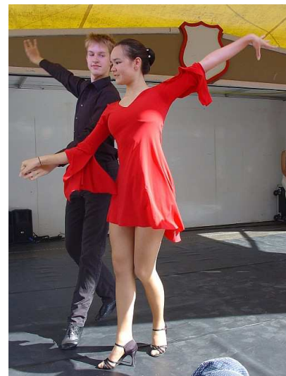
Cha Cha Cha

http://www.vlietdagen.nl/ http://dansaandevliet.nl/ http://www.ddddd.nu/de-dutch-junior-dance-division/ http://www.laresidance.nl/ http://www.dansschooldevotion.nl/