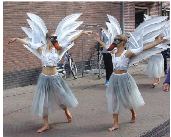
Op weg naar het podium