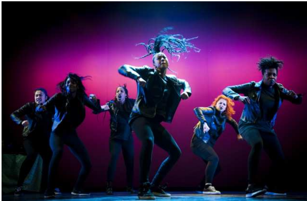
Break A Leg

Aanmelden voor de Crew Competition of de 1 on 1 Battles via www.break-a-leg.nl