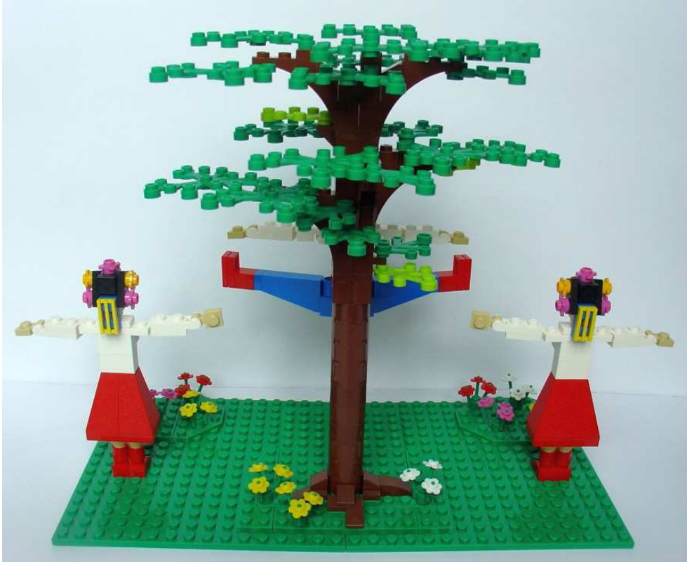
Hopak (Oekraïense dans)