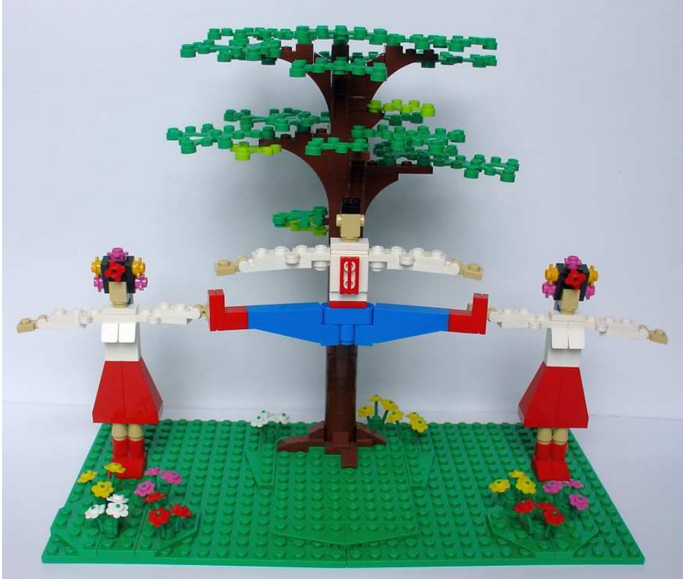
Ontwerp: Fred Bolder