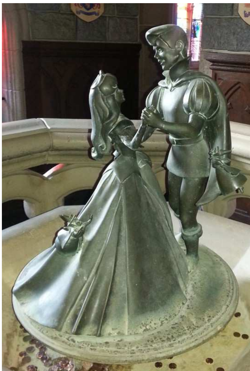
Danspaar in Disneyland Parijs