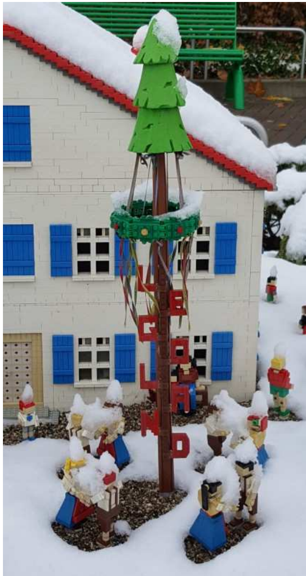
Duitse volksdans in de sneeuw

Zondag 28 oktober en maandag 29 oktober zijn we in LEGOLAND vlakbij Günzburg in Duitsland geweest. Zoals jullie misschien wel weten, maak ik regelmatig dansers van LEGO. Ik was natuurlijk erg benieuwd naar de dansers in LEGOLAND, maar ook naar de andere creaties. De eerste dag lag er een dik pak sneeuw waardoor er veel niet goed zichtbaar was. We hebben toen vooral de binnenattracties bezocht. De tweede dag was bijna alle sneeuw gesmolten. Erg mooi en indrukwekkend allemaal! Hier zijn wat foto's die ik heb gemaakt.